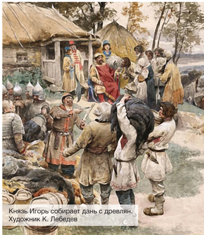
Князь Игорь собирает дань с древлян. Художник К. Лебедев

Зато терминов, определяющих налоговую сферу экономики, было в изобилии: населению приходилось выплачивать огромное количество всевозможных податей, налогов, пошлин, поборов. В связи с этим появилось большое количество однокоренных слов, которые обозначали места, людей, собиравших